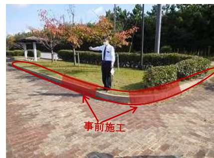
パッキング施工場所