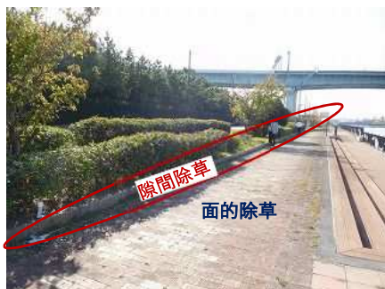
熱湯除草施工場所